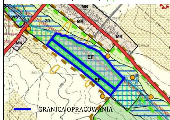
WYRYS ZE STUDIUM UWARUNKOWAŃ I KIERUNKÓW ZAGOSPODAROWANIA PRZESTRZENNEGO GMINY SĘDZISZÓW