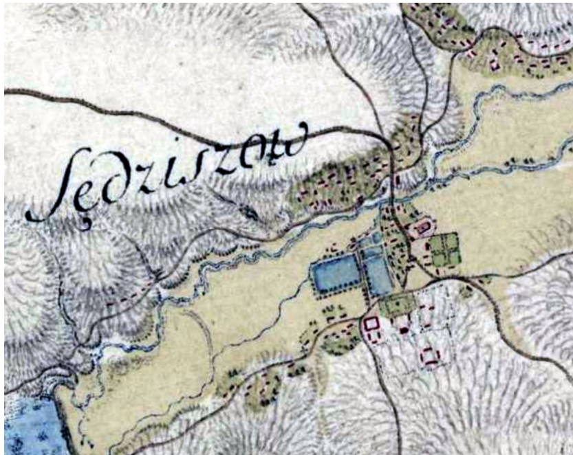
Sędziszów na Mapie Galicji Zachodniej z lat 1801-1804

Bardzo ciekawe założenie posiadał Sędziszów. Składał się z dworu, parku, folwarku, stawów i ogrodów. Zabudowa wiejska znajdowała się po obu stronach Mierzawy. Na lewym brzegu rzeki, na mapie XIX-wiecznego Sędziszowa widoczny jest pusty plac, który obecnie nazywany jest Rynkiem. Być może jest to pozostałość próby założenia miasta. Do dziś pozostała widoczna charakterystyczna zabudowa dwóch stron placu, co przypomina „niedokończony” rynek. Niestety pierwotny Sędziszów został przecięty linią kolejową, która poważnie zaburzyła układ ruralistyczny.