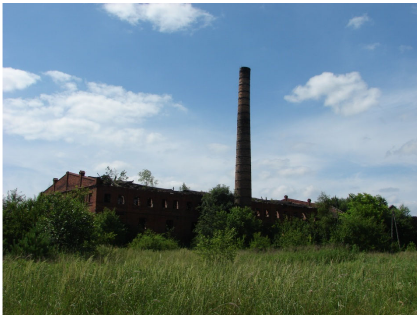
Ruiny cegielni w Mstyczowie

młyny wodne w Krzcięcicach i Sędziszowie, dwór i park w Krzcięcicach oraz Mstyczowie, a także kapliczka w Białowieży.