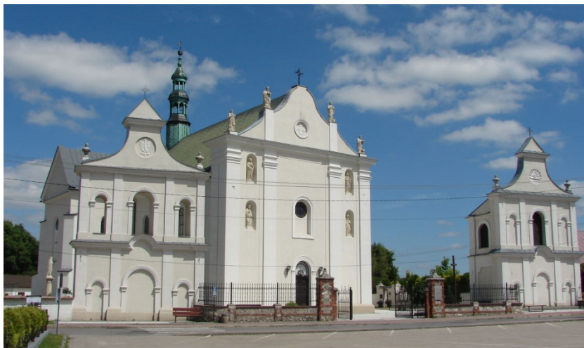
Kościół p.w. św. Piotra i Pawła w Sędziszowie

W latach 2018-2021 odremontowano cztery budynki na Osiedlu Drewnianym poprzez wymianę stolarki okiennej i drzwiowej, docieplenie stropów i ścian zewnętrznych, wykonanie nowego deskowania elewacji. Na trzech blokach wymieniono także pokrycie dachowe na nowe. Koszt inwestycji wynosił 2 361 803,60 zł. W ostatnich latach został również odremontowany zespół kościoła parafialnego w Sędziszowie.