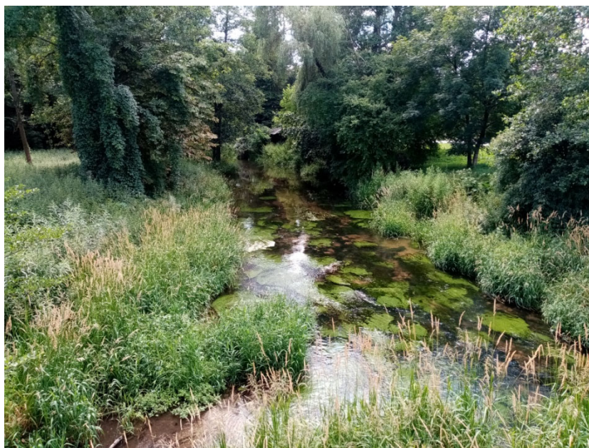
Rzeka Mierzawa w Sędziszowie

Przez teren gminy przepływa rzeka Mierzawa oraz jej dopływy - ciekki wodne: „Lipka”, „od Słupi”, „Łowinianka”, które ją zasilają. Towarzyszą im starorzecza i tereny podmokłe, na których wykształciły się zbiorowiska łąkowo-szuwarowo-bagienne. Są to miejsca występowania rzadkich gatunków ptaków wodno-błotnych. Dolina Mierzawy posiada wysokie walory krajobrazowe. Charakterystycznym elementem szaty roślinnej są bogate zbiorowiska kserotermiczne. Zachodnia i południowo-zachodnia część gminy położona jest w Miechowsko-Działoszyckim Obszarze Chronionego Krajobrazu (M-DzOChK). Obejmuje ona także fragment obszaru Dolina Górnej Mierzwy, w ramach sieci NATURA 2000. W Gminie Sędziszów znajdują się następując pomniki przyrody: buk szkarłatny – przy ul. Dworcowej w Sędziszowie, 4 dęby szypułkowe w miejscowości Mstyczów, dąb szypułkowy w miejscowości Szałas, modrzew europejski w miejscowości Mstyczów.