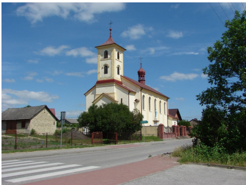
Kościół pw. św. Marcina w Tarnawie

Inne miejscowości takie jak: Piołunka, Łowinia, Pawłowice, Gniewięcin posiadają również starą średniowieczną metrykę.