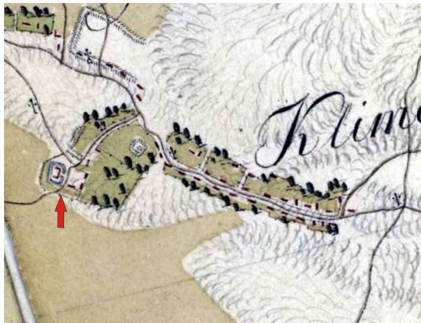
Klimontów na Mapie Galicji Zachodniej z lat 1801-1804 (czerwoną strzałką oznaczono dwór)

Kopiec ziemny, na którym znajdował się dwór otoczony był fosą, której pozostałości widoczne są w terenie.