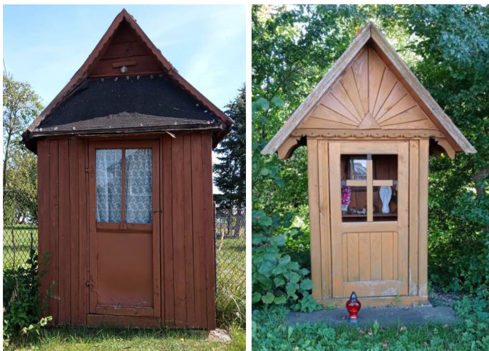
kapliczka w Białowieży i Mstyczowie

Charakterystyczne dla krajobrazu gminy Sędziszów są drewniane kapliczki domkowe w Białowieży, Mstyczowie i Klimontowie oraz murowana w Lipiu. Posiadają one duże wartości artystyczne. Spotykane są również kamienne i drewniane krzyże przydrożne.