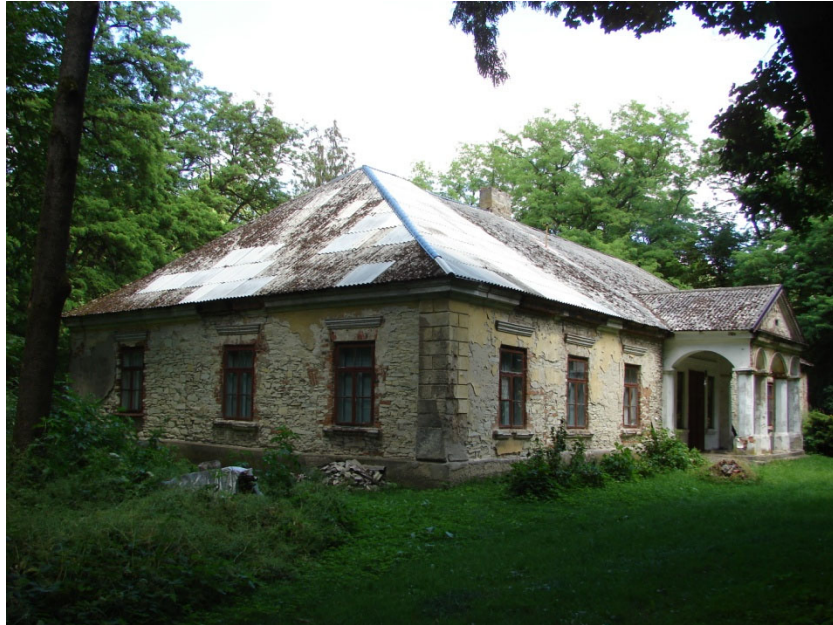
Dwór w Krzcięcicach