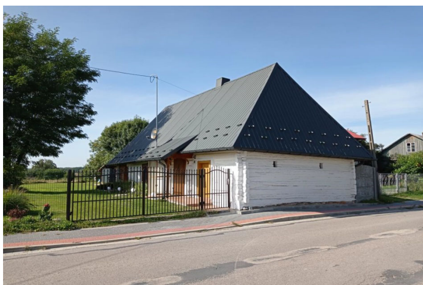
Dom w Mstyczowie

Typowa zabudowa wsi to ulicówka, gdzie domy skupione są wzdłuż głównej osi w postaci drogi. Tradycyjne, drewniane budownictwo zachowało się w niewielkim stopniu, jedynie miejscowość Klimontów może poszczycić się drewnianą, regionalną zabudową. Tylko jeden dom z Mstyczowa znajduje się w Gminnej Ewidencji Zabytków. Jest to dom drewniany, w konstrukcji zrębowej, bielony, nakryty dachem czterospadowym, krytym blachą.