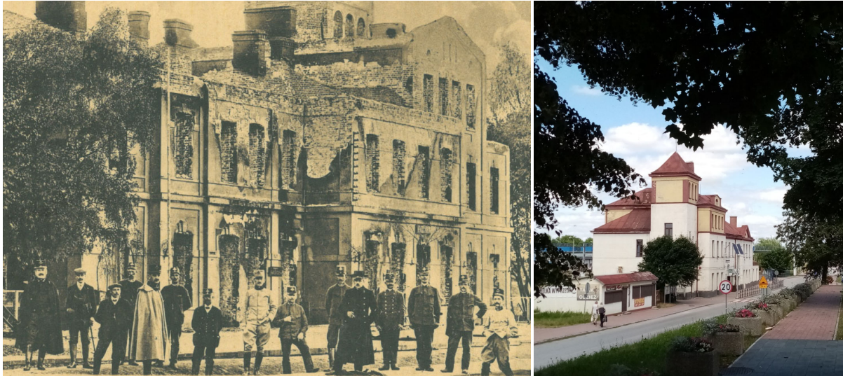
Dworzec kolejowy w Sędziszowie w latach 1914-16 i obecnie

Kolejnym elementem krajobrazu kulturowego są zespoły kościelne. Na terenie gminy Sędziszów znajdują się cztery kościoły, z czego trzy wpisane są do rejestru zabytków (Krzcięcice, Sędziszów, Tarnawa). Kościół w Mstyczowie znajduje się w Wojewódzkiej Ewidencji Zabytków. Najstarszy, późnogotycki kościół w Krzcięcicach, wybudowany w XVI wieku ma największe walory zabytkowe. Niewiele ustępuje mu XVIII wieczny kościół w Sędziszowie, który również posiada dużą wartość jako zabytek.