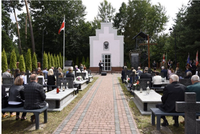
Cmentarz Ofiar Egzekucji z 1944 roku

W latach 2018-2021 odremontowano cztery budynki na Osiedlu Drewnianym poprzez wymianę stolarki okiennej i drzwiowej, docieplenie stropów i ścian zewnętrznych, wykonanie nowego deskowania elewacji. Na trzech blokach wymieniono także pokrycie dachowe na nowe. Koszt inwestycji wynosił 2 361 803,60 zł. W ostatnich latach został również odremontowany zespół kościoła parafialnego w Sędziszowie.