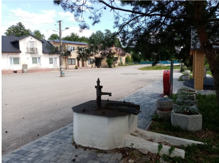
Rynek w Sędziszowie