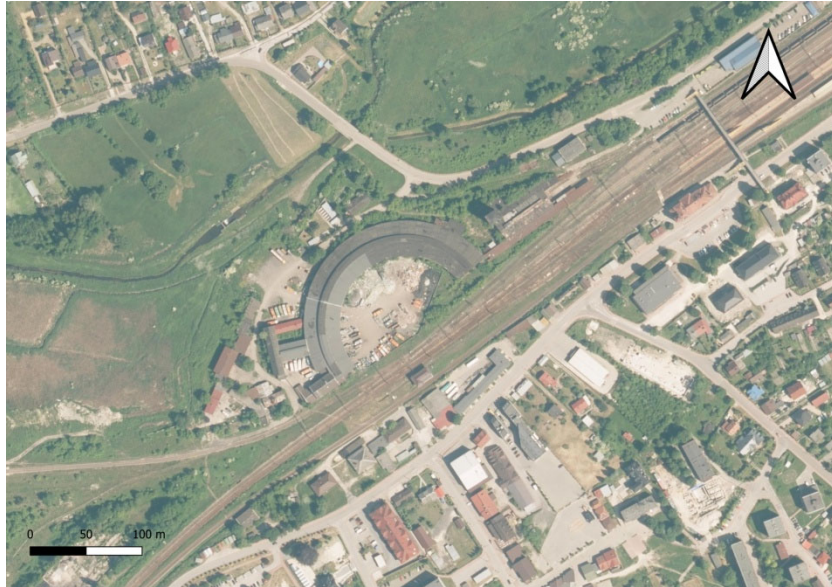
Zdjęcie lotnicze zespołu dworca kolejowego z parowozownią wachlarzową

Ponadto w latach 1939 – 46 powstało osiedle mieszkaniowe pracowników kolei z domkami jednorodzinnymi przy ulicy Kolejowej oraz domami wielorodzinnymi na obecnym osiedlu Drewnianym.