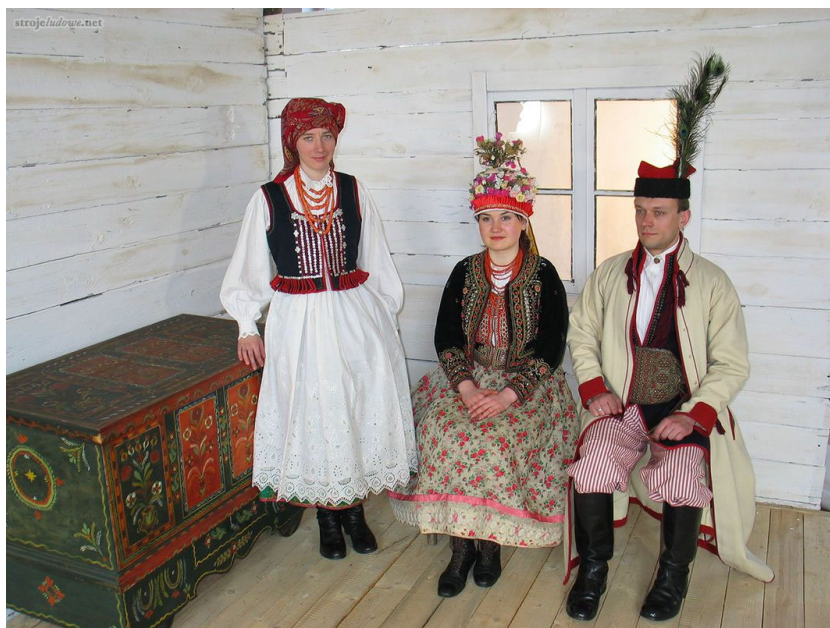
Stroje Krakowiaków Zachodnich

W ujęciu etnograficznym gmina Sędziszów leży na pograniczu grup Krakowiaków Wschodnich i Zachodnich. Męski strój ludowy Krakowiaków Zachodnich to biała koszula i granatowy kaftan, granatowe lub niebieskie, płócienne lub z sukna spodnie w czerwone lub niebieskie prążki, wysokie buty, skórzany pas nabijany gwoździkami, biała, zapinana na haftki i ozdobiona czarnymi lub amarantowymi frędzlami sukmana jako okrycie wierzchnie, czerwona rogatywka z pawim piórem obszyta barankiem (tzw. krakuska). Kobiety natomiast nosiły białą haftowaną koszulę, płócienną halkę, kwiecistą spódnicę, zapaskę i gorset, na głowie białe lub czerwone, haftowane chusty. Gorsety były koloru czarnego lub granatowego, ozdobione haftem, guzikami perłowymi, koralikami, cekinami itp. Noszono również duże kraciaste chusty naramienne. Ważnym elementem stroju były czerwone korale.