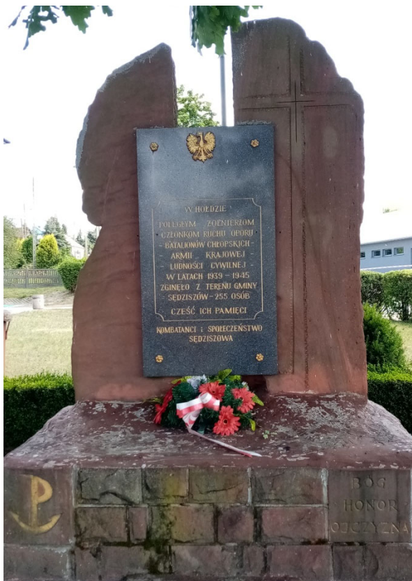
Pomnik w hołdzie poległym żołnierzom w czasie II wojny światowej w Sędziszowie

Typowa zabudowa wsi to ulicówka, gdzie domy skupione są wzdłuż głównej osi w postaci drogi. Tradycyjne, drewniane budownictwo zachowało się w niewielkim stopniu, jedynie miejscowość Klimontów może poszczycić się drewnianą, regionalną zabudową. Tylko jeden dom z Mstyczowa znajduje się w Gminnej Ewidencji Zabytków. Jest to dom drewniany, w konstrukcji zrębowej, bielony, nakryty dachem czterospadowym, krytym blachą.