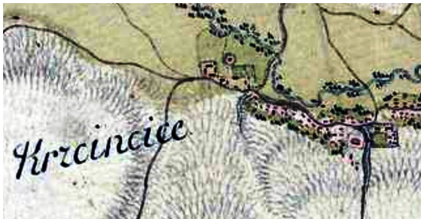
Krzcięcice na Mapie Galicji Zachodniej z lat 1801-1804