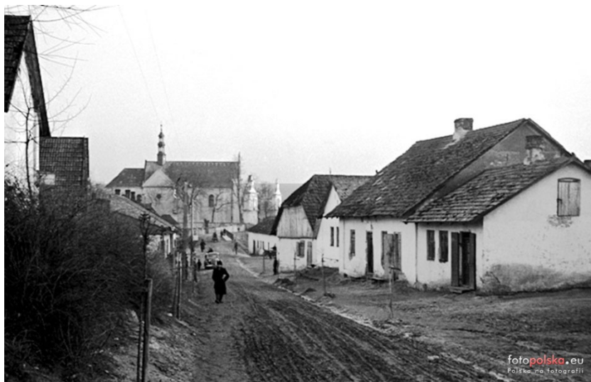
ulica Polna z widocznym kościołem w Sędziszowie (www.fotopolska.eu)

Po zbudowaniu linii kolejowej, stacji i parowozowni zabudowa Sędziszowa przesunęła się w kierunku południowo-zachodnim. Centrum Sędziszowa znajduje się obecnie wokół stacji kolejowej. Powstało wówczas szereg budynków takich jak dworzec kolejowy, budynek kolejowy, budynek administracyjny, wieża ciśnienia oraz szczególnie cenna, jako zabytek techniki, parowozownia wachlarzowa z obrotnicą. Wybudowana została w latach 1882-84 do obsługi parowozów kursujących na trasie Dąbrowa Górnicza – Sędziszów. W 1927 roku została zamknięta dla celów trakcyjnych, ale podczas okupacji ponownie uruchomiona. W czasie II wojny światowej dobudowano wachlarz na 37 stanowisk oraz budynki zaplecza, w tym nową wieżę ciśnienia. Po wojnie nadal funkcjonowała, powstał również zakład naprawy elektrowozów. Obiekt zakończył swoją działalność na początku lat 90. XX w. Obecnie parowozownia jest w złym stanie. Na jej terenie znajduje się sortownia śmieci.