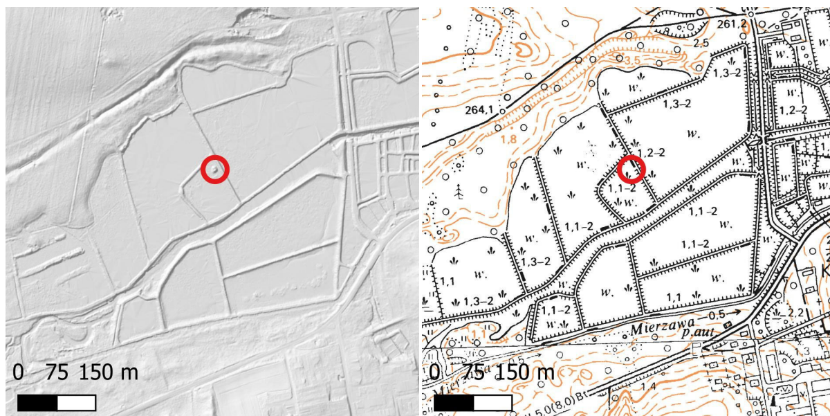
Położenie gródka – reliktyw rezydencji możnowładczej w Krzelowie (stan. 3 AZP 92-57/27)