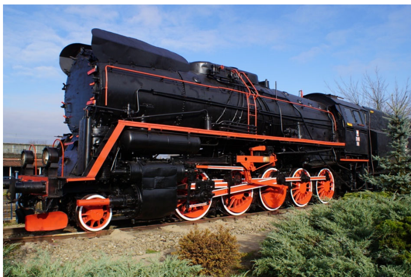
Lokomotywa parowa Ty51-15 stojąca przy ulicy Dworcowej w Sędziszowie

Prawa miejskie otrzymał Sędziszów w 1990 roku.