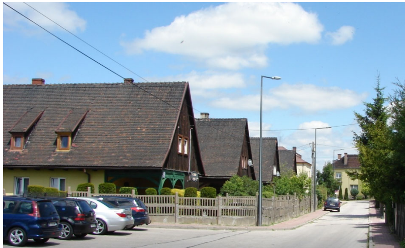
Ulica Kolejowa w Sędziszowie

Ponadto w latach 1939 – 46 powstało osiedle mieszkaniowe pracowników kolei z domkami jednorodzinnymi przy ulicy Kolejowej oraz domami wielorodzinnymi na obecnym osiedlu Drewnianym.