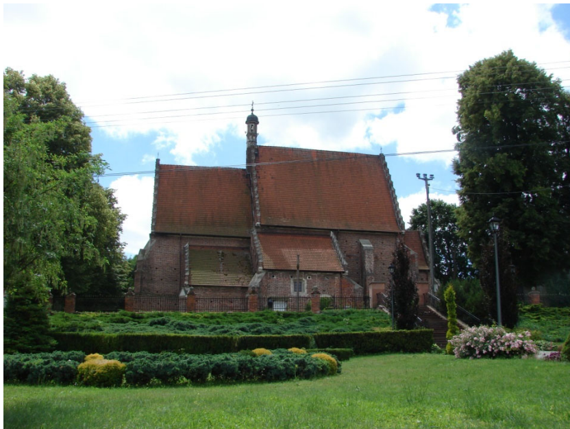
Kościół p.w. św. Prokopa w Krzcięcicach

Kolejnym elementem krajobrazu kulturowego są zespoły kościelne. Na terenie gminy Sędziszów znajdują się cztery kościoły, z czego trzy wpisane są do rejestru zabytków (Krzcięcice, Sędziszów, Tarnawa). Kościół w Mstyczowie znajduje się w Wojewódzkiej Ewidencji Zabytków. Najstarszy, późnogotycki kościół w Krzcięcicach, wybudowany w XVI wieku ma największe walory zabytkowe. Niewiele ustępuje mu XVIII wieczny kościół w Sędziszowie, który również posiada dużą wartość jako zabytek.